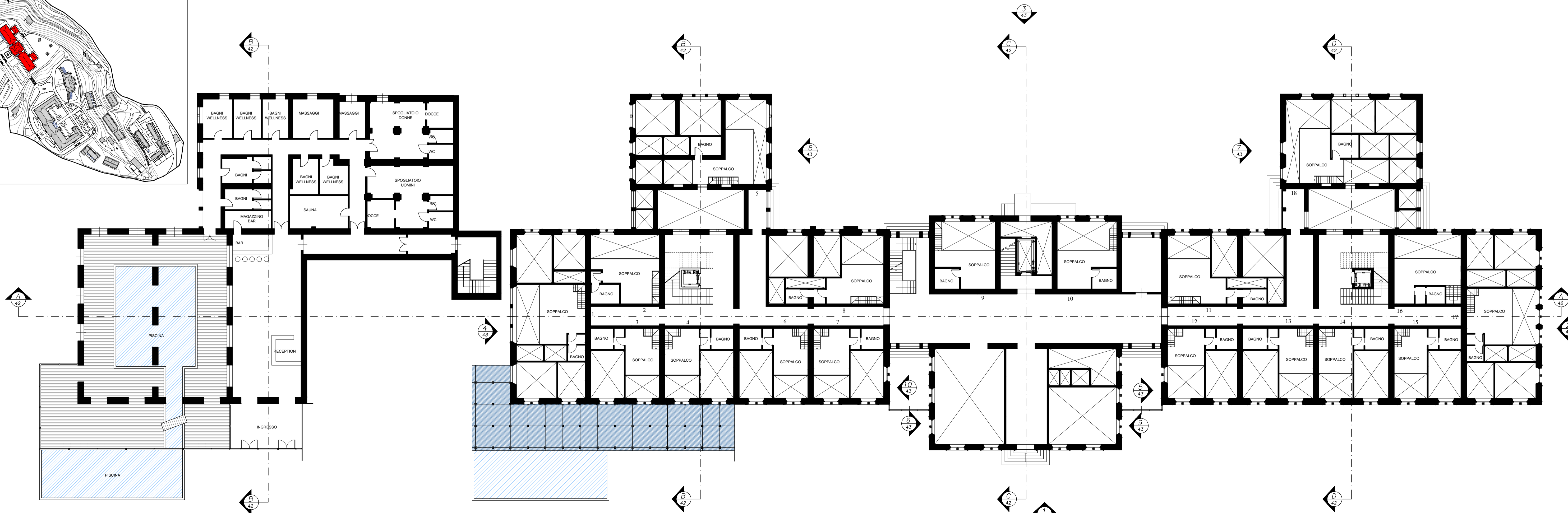
PIANTA PIANO SEMINTERRATO