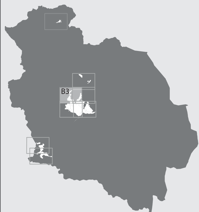
tavola B3 scala 1: 2000 Volterra usi del suolo e modalità di intervento ed attuazione

Modificato a seguito dell'accoglimento delle osservazioni Dicembre 2013