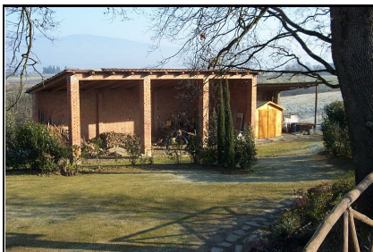
Foto: 10 Data ripresa: 10/02/2006 Edificio: 357/B File: 357-10.JPG