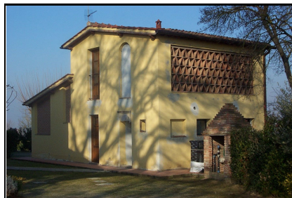
Foto: 11 Data ripresa: 10/02/2006 Edificio: 357/A File: 357-11.JPG