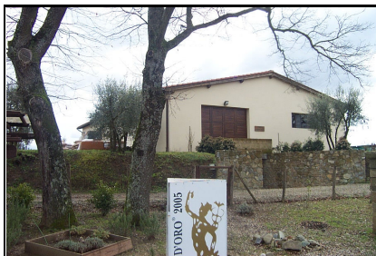
Foto: 11 Data ripresa: 24/02/2006 Edificio: 353/C File: 353-11.JPG