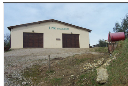
Foto: 27 Data ripresa: 24/02/2006 Edificio: 353/C File: 353-27.JPG