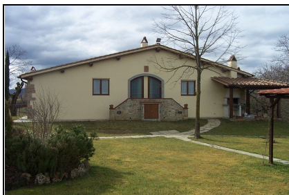
Foto: 16 Data ripresa: 24/02/2006 Edificio: 353/A File: 353-16.JPG