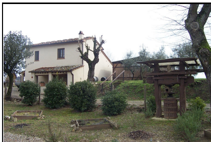
Foto: 10 Data ripresa: 24/02/2006 Edificio: 353/B File: 353-10.JPG