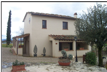
Foto: 08 Data ripresa: 24/02/2006 Edificio: 353/B File: 353-08.JPG