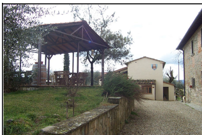
Foto: 19 Data ripresa: 24/02/2006 Edificio: 353/B File: 353-19.JPG