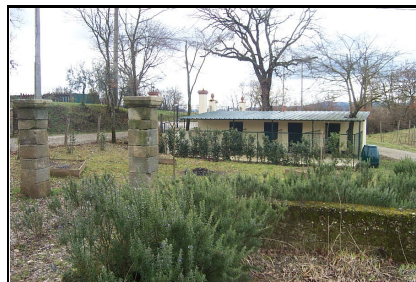
Foto: 12 Data ripresa: 24/02/2006 Edificio: 353/D File: 353-12.JPG