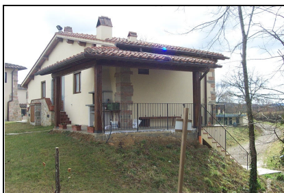
Foto: 17 Data ripresa: 24/02/2006 Edificio: 353/A File: 353-17.JPG