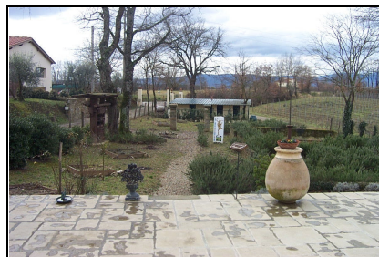
Foto: 09 Data ripresa: 24/02/2006 Edificio: 353/D File: 353-09.JPG