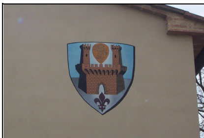
Foto: 20 Data ripresa: 24/02/2006 Edificio: 353/B File: 353-20.JPG