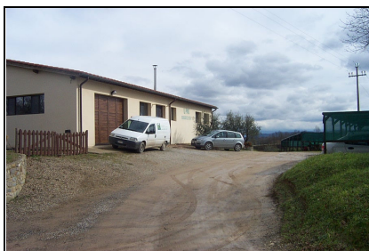
Foto: 05 Data ripresa: 24/02/2006 Edificio: 353/C File: 353-05.JPG