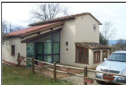
Foto: 22 Data ripresa: 24/02/2006 Edificio: 353/B File: 353-22.JPG