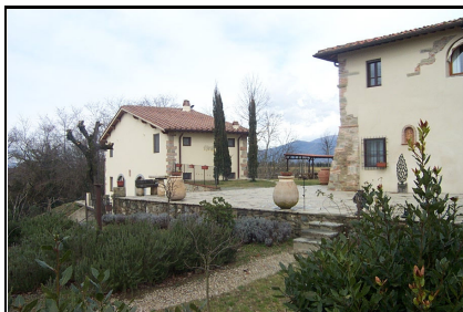
Foto: 07 Data ripresa: 24/02/2006 Edificio: 353/A File: 353-07.JPG