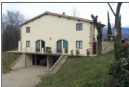
Foto: 13 Data ripresa: 24/02/2006 Edificio: 353/A File: 353-13.JPG