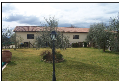
Foto: 23 Data ripresa: 24/02/2006 Edificio: 353/C File: 353-23.JPG