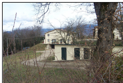
Foto: 06 Data ripresa: 24/02/2006 Edificio: 353/D File: 353-06.JPG