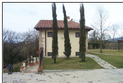
Foto: 15 Data ripresa: 24/02/2006 Edificio: 353/A File: 353-15.JPG