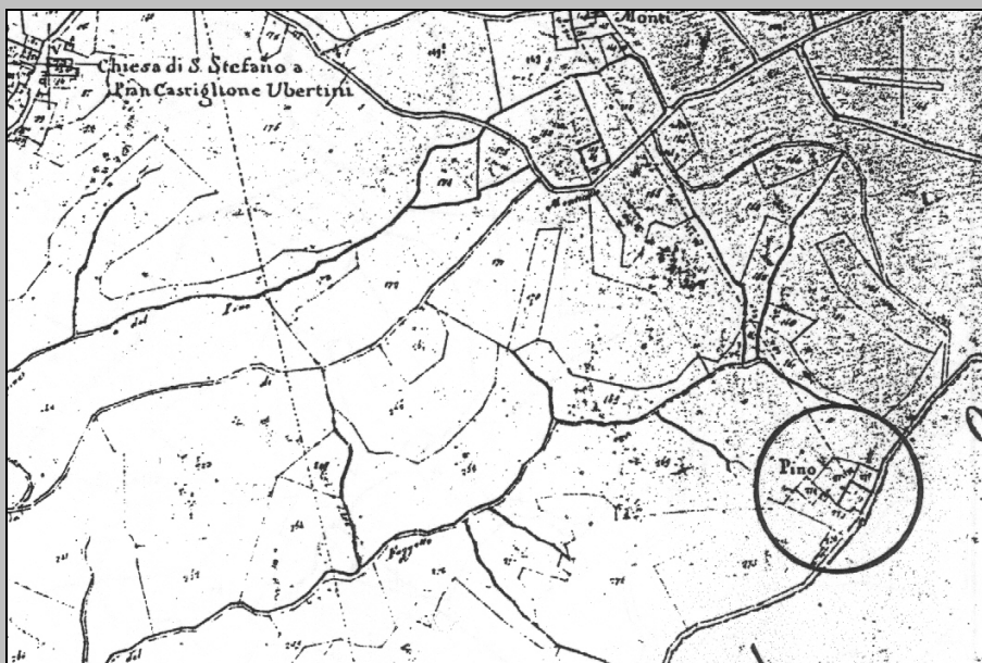
ESTRATTO PLANIMETRICO CATASTO LORENESE