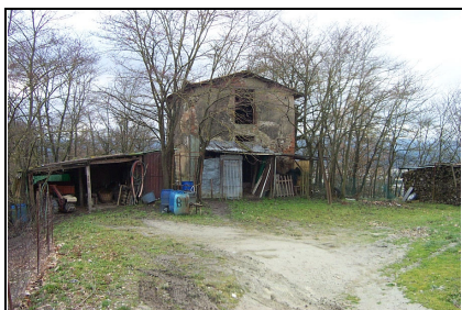
Foto: 04 Data ripresa: 20/02/2006 Edificio: 330/A File: 330-04.JPG