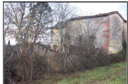
Foto: 12 Data ripresa: 21/02/2006 Edificio: 299/A File: 299-12.JPG