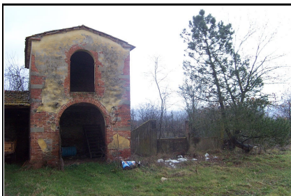
Foto: 10 Data ripresa: 21/02/2006 Edificio: 299/A File: 299-10.JPG