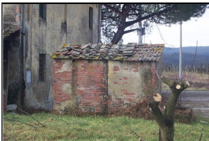
Foto: 07 Data ripresa: 21/02/2006 Edificio: 299/C File: 299-07.JPG