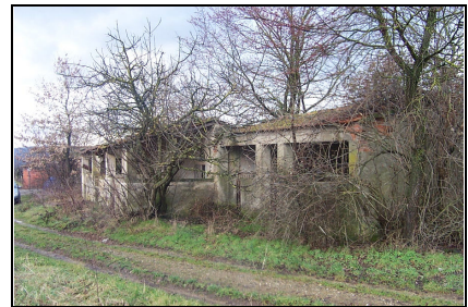
Foto: 06 Data ripresa: 21/02/2006 Edificio: 299/B File: 299-06.JPG