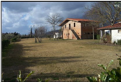
Foto: 10 Data ripresa: 17/02/2006 Edificio: 289/A File: 289-10.JPG