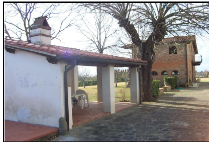
Foto: 08 Data ripresa: 17/02/2006 Edificio: 289/B File: 289-08.JPG