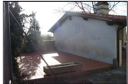
Foto: 09 Data ripresa: 17/02/2006 Edificio: 289/B File: 289-09.JPG