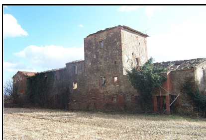
Foto: 08 Data ripresa: 17/02/2006 Edificio: 286/B File: 286-08.JPG