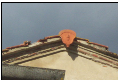
Foto: 11 Data ripresa: 17/02/2006 Edificio: 286/A File: 286-11.JPG