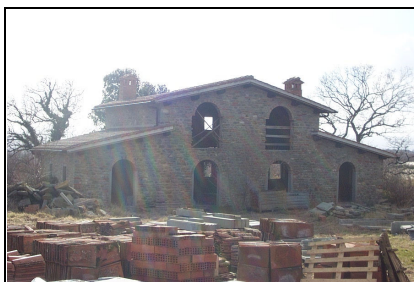
Foto: 05 Data ripresa: 17/02/2006 Edificio: 286/E File: 286-05.JPG