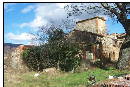
Foto: 06 Data ripresa: 17/02/2006 Edificio: 286/C File: 286-06.JPG