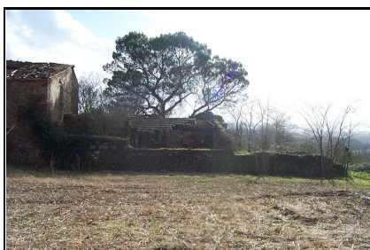
Foto: 07 Data ripresa: 17/02/2006 Edificio: 286/C File: 286-07.JPG