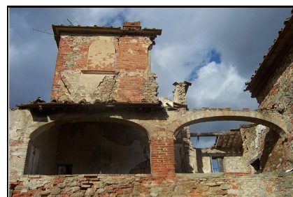
Foto: 12 Data ripresa: 17/02/2006 Edificio: 286/B File: 286-12.JPG