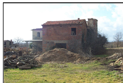
Foto: 09 Data ripresa: 17/02/2006 Edificio: 286/A File: 286-09.JPG