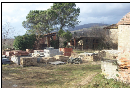
Foto: 04 Data ripresa: 17/02/2006 Edificio: 286/D File: 286-04.JPG