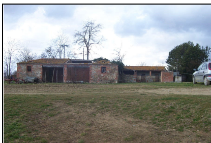
Foto: 05 Data ripresa: 17/02/2006 Edificio: 283/A File: 283-05.JPG