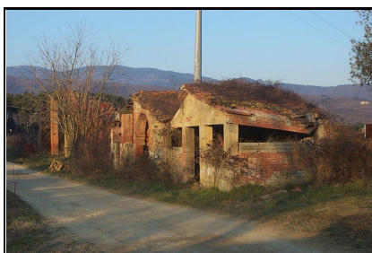
Foto: 08 Data ripresa: 14/02/2006 Edificio: 280/A File: 280-08.JPG