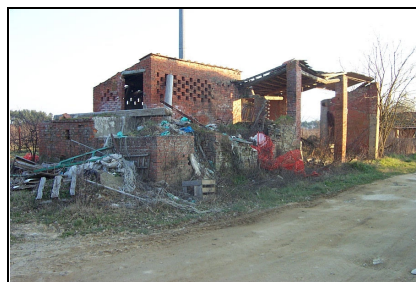
Foto: 06 Data ripresa: 14/02/2006 Edificio: 280/B File: 280-06.JPG