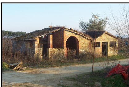
Foto: 07 Data ripresa: 14/02/2006 Edificio: 280/A File: 280-07.JPG