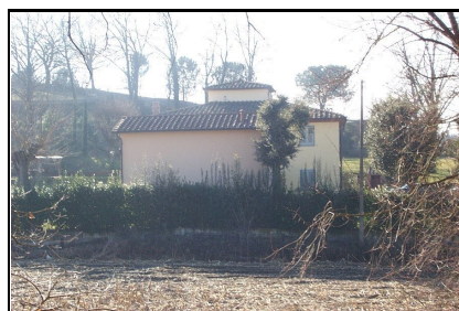
Foto: 09 Data ripresa: 04/01/2006 Edificio: 252/A File: 252-09.JPG