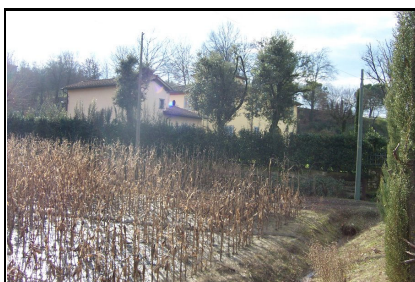
Foto: 08 Data ripresa: 04/01/2006 Edificio: 252/A File: 252-08.JPG