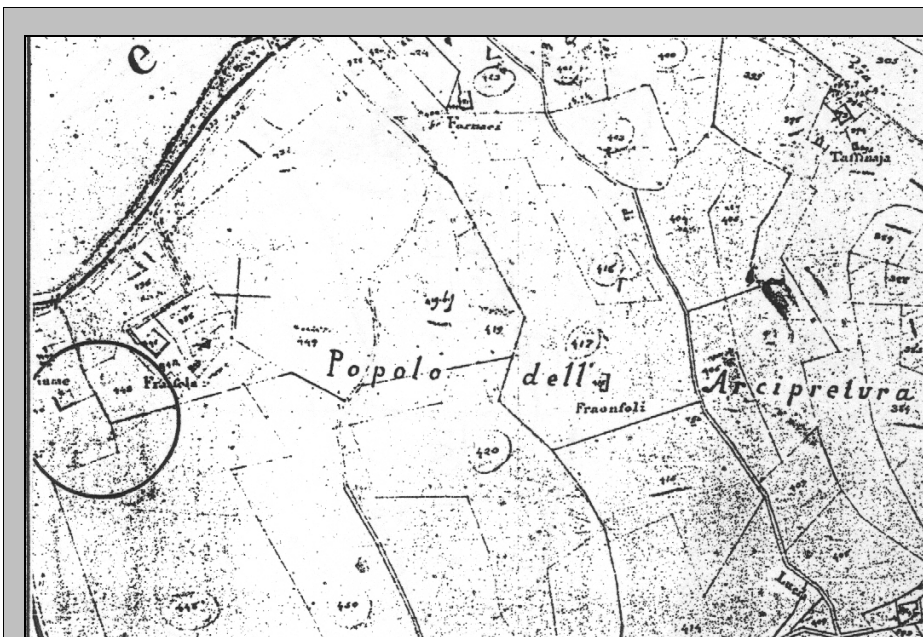
ESTRATTO PLANIMETRICO CATASTO LORENESE