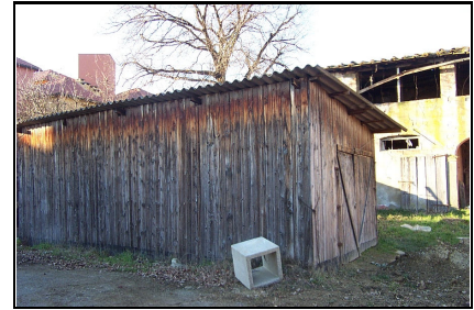
Foto: 09 Data ripresa: 11/01/2006 Edificio: 244/A File: 244-09.JPG