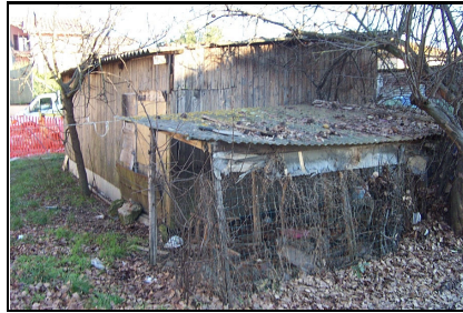
Foto: 08 Data ripresa: 11/01/2006 Edificio: 244/A File: 244-08.JPG