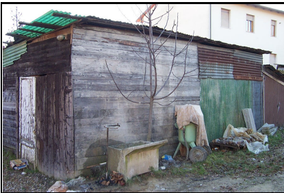
Foto: 10 Data ripresa: 11/01/2006 Edificio: 244/B File: 244-10.JPG