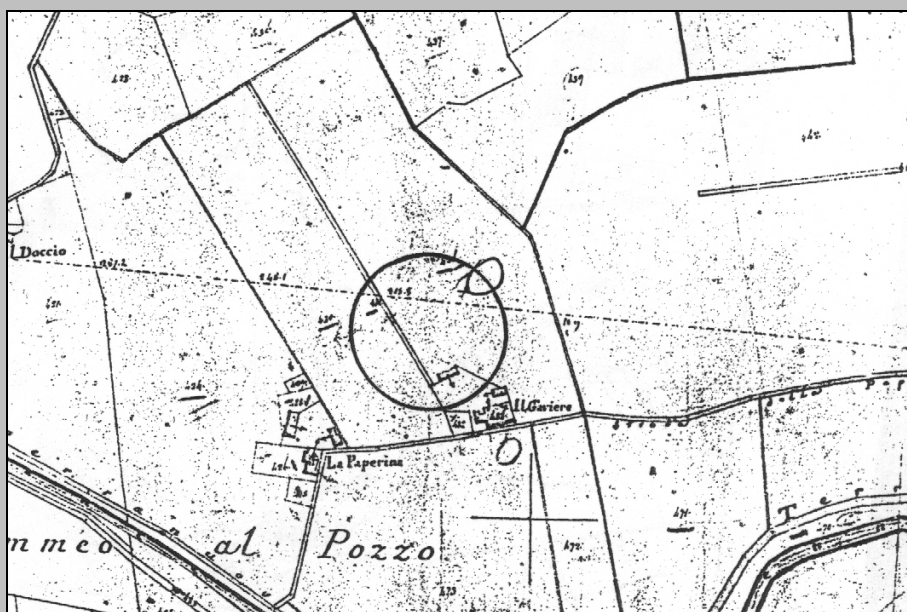
ESTRATTO PLANIMETRICO CATASTO LORENESE