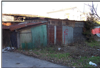
Foto: 11 Data ripresa: 11/01/2006 Edificio: 244/B File: 244-11.JPG