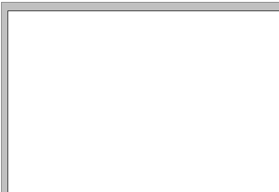
ESTRATTO PLANIMETRICO CATASTO LORENESE