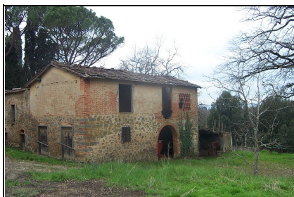
Foto: 19 Data ripresa: 27/03/2006 Edificio: 217/B File: 217-19.JPG