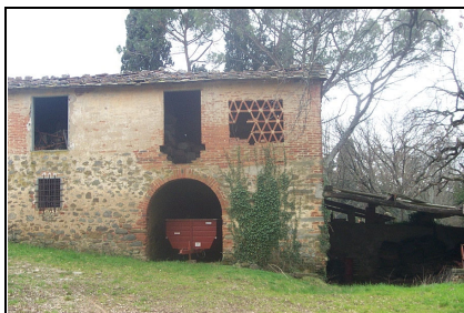
Foto: 16 Data ripresa: 27/03/2006 Edificio: 217/B File: 217-16.JPG