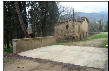
Foto: 12 Data ripresa: 27/03/2006 Edificio: 217/B File: 217-12.JPG