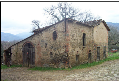
Foto: 13 Data ripresa: 27/03/2006 Edificio: 217/B File: 217-13.JPG