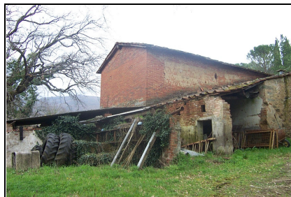
Foto: 14 Data ripresa: 27/03/2006 Edificio: 217/B File: 217-14.JPG