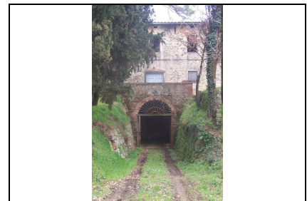
Foto: 15 Data ripresa: 27/03/2006 Edificio: 217/A File: 217-15.JPG