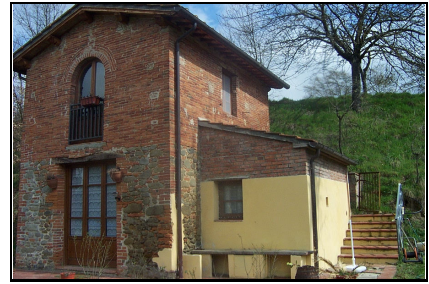
Foto: 03 Data ripresa: 27/03/2006 Edificio: 209/A File: 209-03.JPG