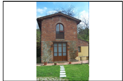
Foto: 09 Data ripresa: 27/03/2006 Edificio: 209/A File: 209-09.JPG