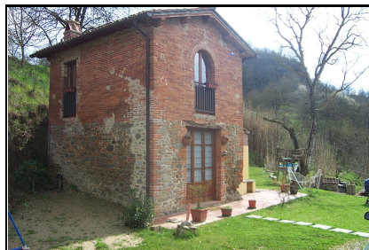
Foto: 11 Data ripresa: 27/03/2006 Edificio: 209/A File: 209-11.JPG