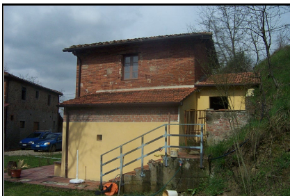
Foto: 10 Data ripresa: 27/03/2006 Edificio: 209/A File: 209-10.JPG