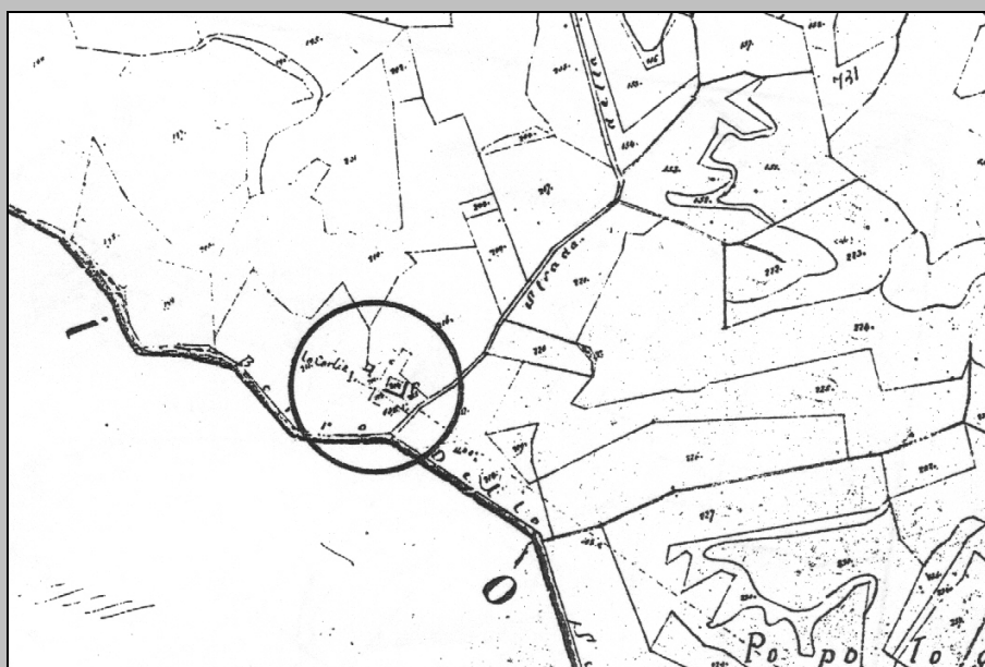
ESTRATTO PLANIMETRICO CATASTO LORENESE