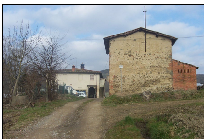
Foto: 11 Data ripresa: 06/02/2006 Edificio: 150/A File: 150-11.JPG