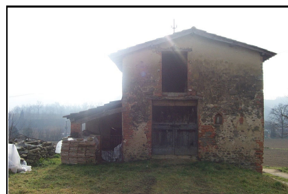
Foto: 09 Data ripresa: 06/02/2006 Edificio: 150/A File: 150-09.JPG