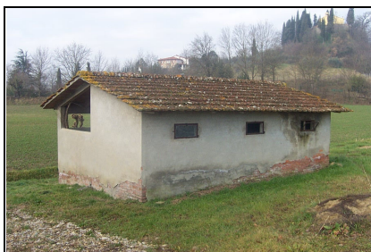
Foto: 05 Data ripresa: 06/02/2006 Edificio: 150/B File: 150-05.JPG