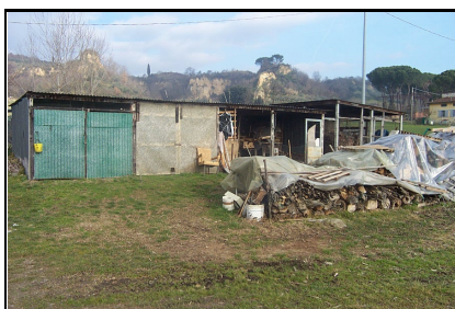
Foto: 08 Data ripresa: 06/02/2006 Edificio: 150/C File: 150-08.JPG