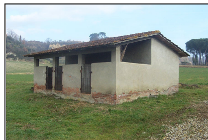
Foto: 06 Data ripresa: 06/02/2006 Edificio: 150/B File: 150-06.JPG