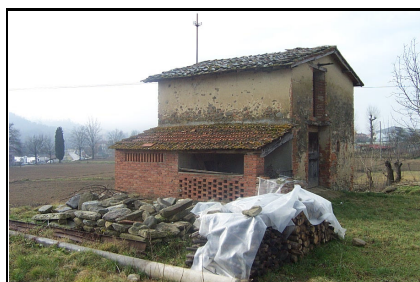
Foto: 10 Data ripresa: 06/02/2006 Edificio: 150/A File: 150-10.JPG