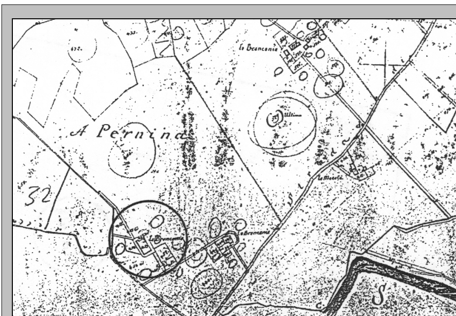
ESTRATTO PLANIMETRICO CATASTO LORENESE