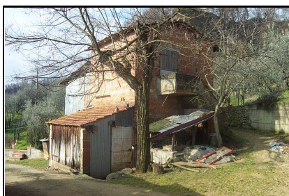
Foto: 08 Data ripresa: 06/02/2006 Edificio: 145/E File: 145-08.JPG