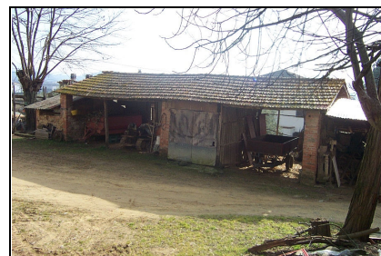
Foto: 06 Data ripresa: 06/02/2006 Edificio: 145/D File: 145-06.JPG