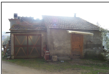
Foto: 05 Data ripresa: 06/02/2006 Edificio: 145/C File: 145-05.JPG