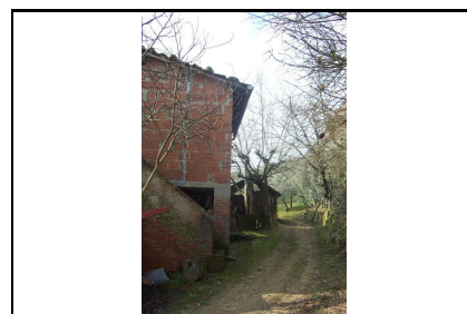
Foto: 09 Data ripresa: 06/02/2006 Edificio: 145/E File: 145-09.JPG