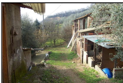
Foto: 07 Data ripresa: 06/02/2006 Edificio: 145/D File: 145-07.JPG