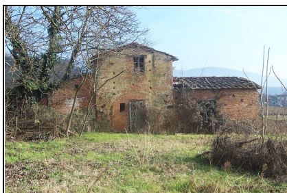
Foto: 04 Data ripresa: 06/02/2006 Edificio: 145/B File: 145-04.JPG