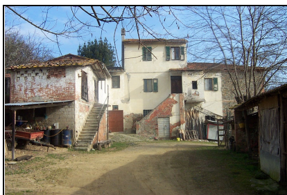
Foto: 02 Data ripresa: 06/02/2006 Edificio: 145/A File: 145-02.JPG