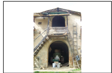
Foto: 06 Data ripresa: 27/03/2006 Edificio: 137/A File: 137-06.JPG