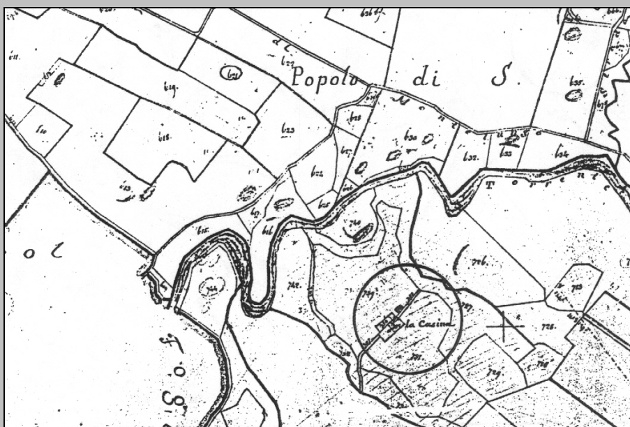
ESTRATTO PLANIMETRICO CATASTO LORENESE