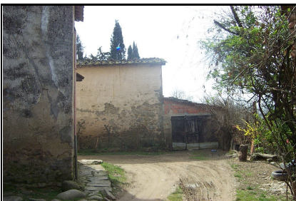
Foto: 10 Data ripresa: 27/03/2006 Edificio: 137/A File: 137-10.JPG