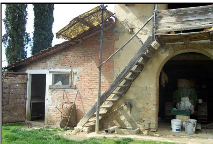
Foto: 07 Data ripresa: 27/03/2006 Edificio: 137/A File: 137-07.JPG