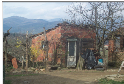
Foto: 08 Data ripresa: 27/03/2006 Edificio: 137/C File: 137-08.JPG