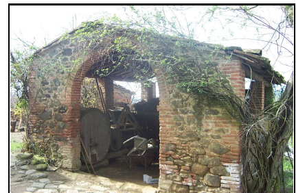
Foto: 09 Data ripresa: 27/03/2006 Edificio: 137/B File: 137-09.JPG