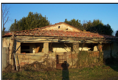
Foto: 11 Data ripresa: 14/02/2006 Edificio: 135/B File: 135-11.JPG