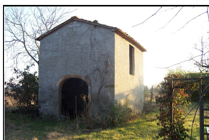
Foto: 07 Data ripresa: 14/02/2006 Edificio: 135/A File: 135-07.JPG