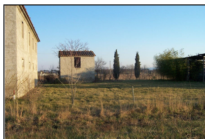
Foto: 06 Data ripresa: 14/02/2006 Edificio: 135/A File: 135-06.JPG