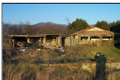
Foto: 10 Data ripresa: 14/02/2006 Edificio: 135/B File: 135-10.JPG