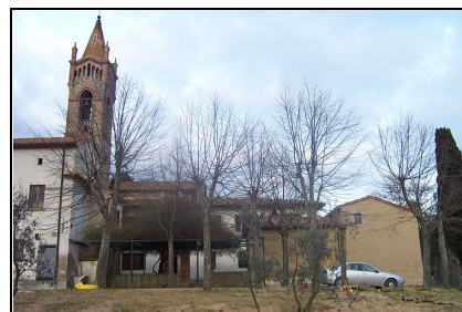
Foto: 03 Data ripresa: 06/02/2006 Edificio: 111/B File: 111-03.JPG