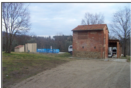
Foto: 04 Data ripresa: 06/02/2006 Edificio: 111/C File: 111-04.JPG