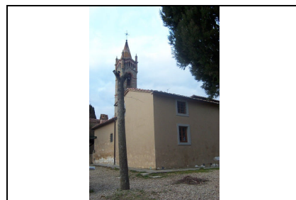
Foto: 06 Data ripresa: 06/02/2006 Edificio: 111/B File: 111-06.JPG