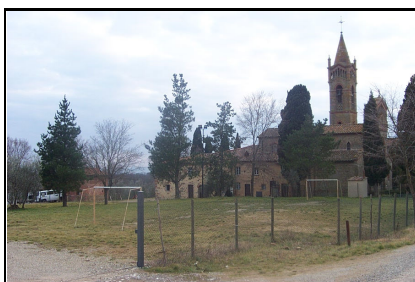
Foto: 08 Data ripresa: 06/02/2006 Edificio: 111/A File: 111-08.JPG