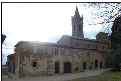
Foto: 01 Data ripresa: 06/02/2006 Edificio: 111/A File: 111-01.JPG