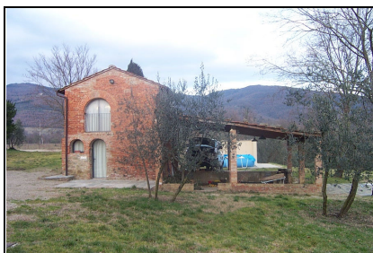
Foto: 05 Data ripresa: 06/02/2006 Edificio: 111/C File: 111-05.JPG