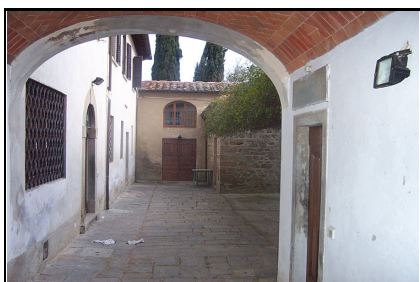
Foto: 07 Data ripresa: 06/02/2006 Edificio: 111/B File: 111-07.JPG