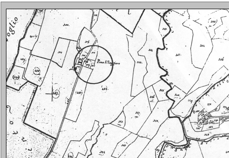
ESTRATTO PLANIMETRICO CATASTO LORENESE