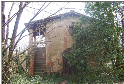
Foto: 07 Data ripresa: 27/03/2006 Edificio: 097/A File: 097-07.JPG