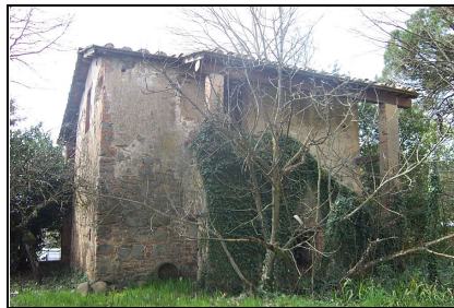
Foto: 05 Data ripresa: 27/03/2006 Edificio: 097/A File: 097-05.JPG