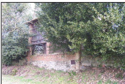
Foto: 13 Data ripresa: 27/03/2006 Edificio: 097/A File: 097-13.JPG