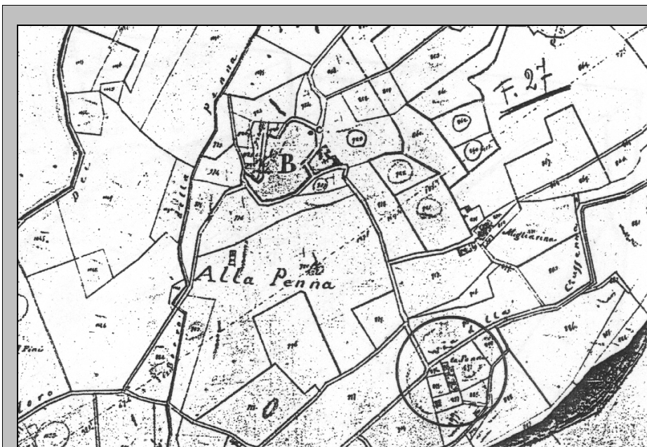
ESTRATTO PLANIMETRICO CATASTO LORENESE