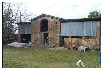
Foto: 03 Data ripresa: 06/02/2006 Edificio: 079/A File: 079-03.JPG