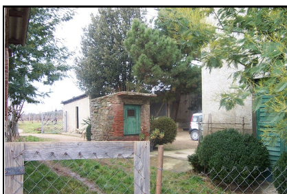
Foto: 07 Data ripresa: 06/02/2006 Edificio: 079/B File: 079-07.JPG