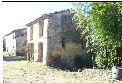
Foto: 08 Data ripresa: 02/02/2006 Edificio: 063/A File: 063-08.JPG