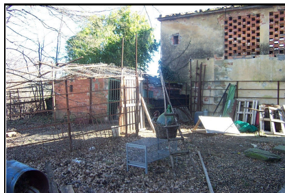
Foto: 11 Data ripresa: 02/02/2006 Edificio: 063/A File: 063-11.JPG