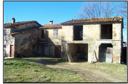
Foto: 03 Data ripresa: 02/02/2006 Edificio: 063/A File: 063-03.JPG