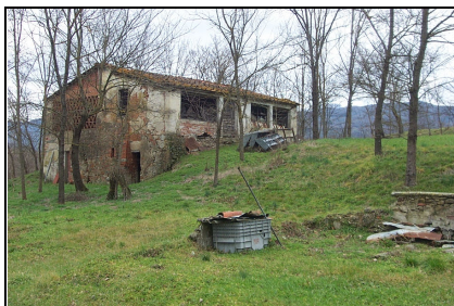
Foto: 16 Data ripresa: 22/02/2006 Edificio: 055/B File: 055-16.JPG