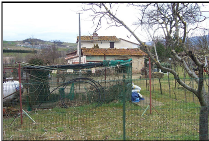
Foto: 10 Data ripresa: 22/02/2006 Edificio: 055/A File: 055-10.JPG