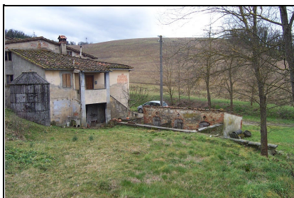
Foto: 20 Data ripresa: 22/02/2006 Edificio: 055/C File: 055-20.JPG