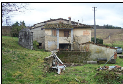
Foto: 17 Data ripresa: 22/02/2006 Edificio: 055/C File: 055-17.JPG