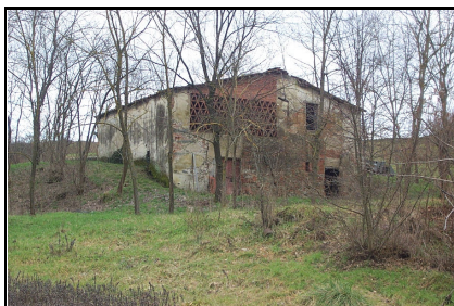
Foto: 22 Data ripresa: 22/02/2006 Edificio: 055/B File: 055-22.JPG