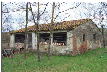
Foto: 19 Data ripresa: 22/02/2006 Edificio: 055/B File: 055-19.JPG