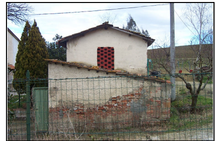
Foto: 06 Data ripresa: 22/02/2006 Edificio: 055/A File: 055-06.JPG