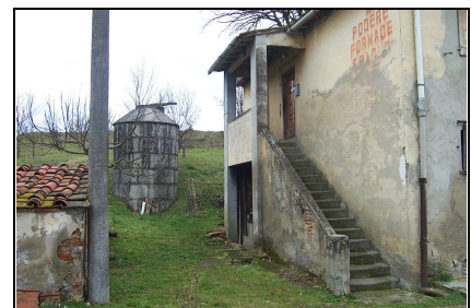
Foto: 15 Data ripresa: 22/02/2006 Edificio: 055/C File: 055-15.JPG