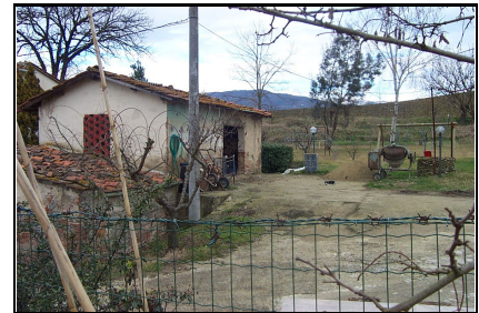
Foto: 09 Data ripresa: 22/02/2006 Edificio: 055/A File: 055-09.JPG