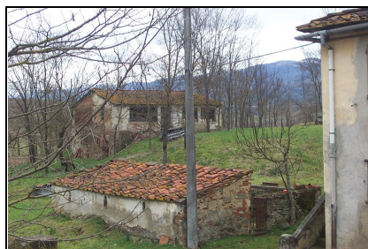
Foto: 14 Data ripresa: 22/02/2006 Edificio: 055/C File: 055-14.JPG