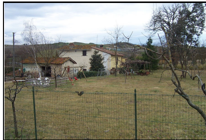
Foto: 11 Data ripresa: 22/02/2006 Edificio: 055/A File: 055-11.JPG