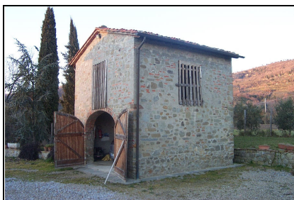
Foto: 05 Data ripresa: 02/02/2006 Edificio: 046/B File: 046-05.JPG