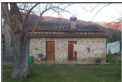
Foto: 07 Data ripresa: 02/02/2006 Edificio: 046/A File: 046-07.JPG