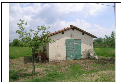
Foto: 14 Data ripresa: 12/05/2006 Edificio: 046/D File: 046-14.JPG