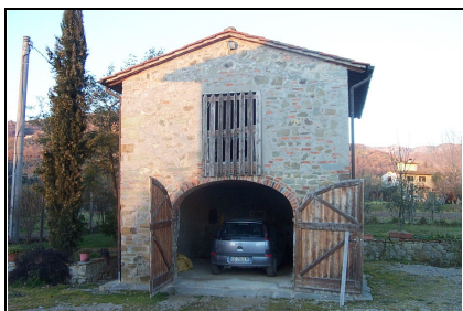
Foto: 04 Data ripresa: 02/02/2006 Edificio: 046/B File: 046-04.JPG