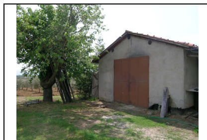
Foto: 15 Data ripresa: 12/05/2006 Edificio: 046/C File: 046-15.JPG