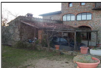
Foto: 11 Data ripresa: 02/02/2006 Edificio: 046/A File: 046-11.JPG