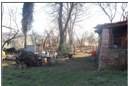
Foto: 04 Data ripresa: 02/02/2006 Edificio: 039/A File: 039-04.JPG