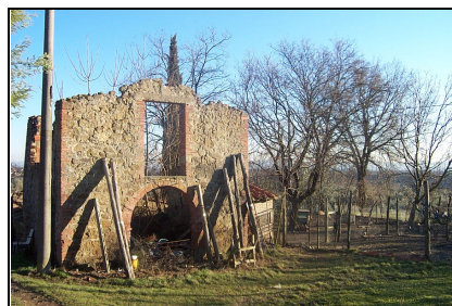
Foto: 03 Data ripresa: 02/02/2006 Edificio: 039/A File: 039-03.JPG