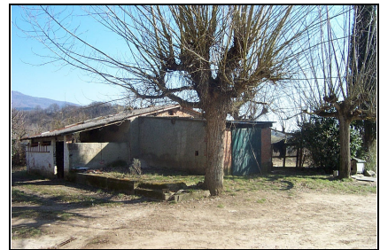
Foto: 06 Data ripresa: 14/02/2006 Edificio: 012/B File: 012-06.JPG