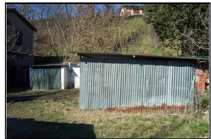
Foto: 09 Data ripresa: 14/02/2006 Edificio: 012/A File: 012-09.JPG