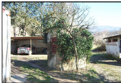
Foto: 08 Data ripresa: 14/02/2006 Edificio: 012/A File: 012-08.JPG