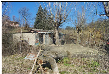
Foto: 07 Data ripresa: 14/02/2006 Edificio: 012/C File: 012-07.JPG