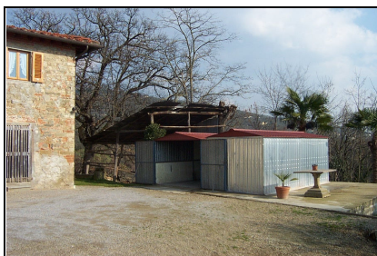
Foto: 05 Data ripresa: 10/02/2006 Edificio: 007/A File: 007-05.JPG