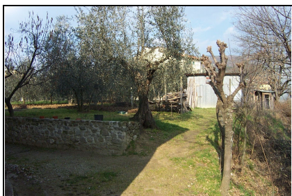
Foto: 04 Data ripresa: 10/02/2006 Edificio: 007/B File: 007-04.JPG