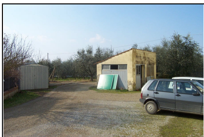
Foto: 04 Data ripresa: 10/02/2006 Edificio: 006/A File: 006-04.JPG