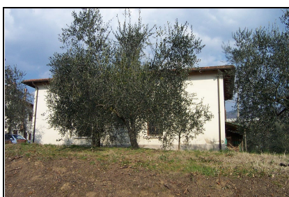
Foto: 14 Data ripresa: 10/02/2006 Edificio: 001/B File: 001-14.JPG