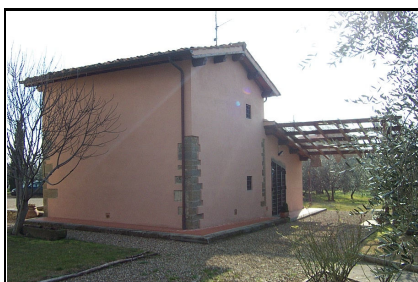
Foto: 10 Data ripresa: 10/02/2006 Edificio: 001/A File: 001-10.JPG