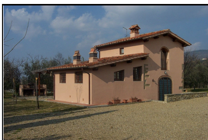
Foto: 07 Data ripresa: 10/02/2006 Edificio: 001/A File: 001-07.JPG