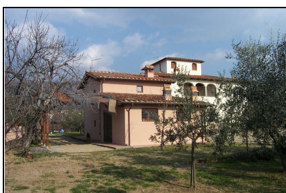
Foto: 13 Data ripresa: 10/02/2006 Edificio: 001/A File: 001-13.JPG