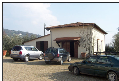
Foto: 06 Data ripresa: 10/02/2006 Edificio: 001/B File: 001-06.JPG