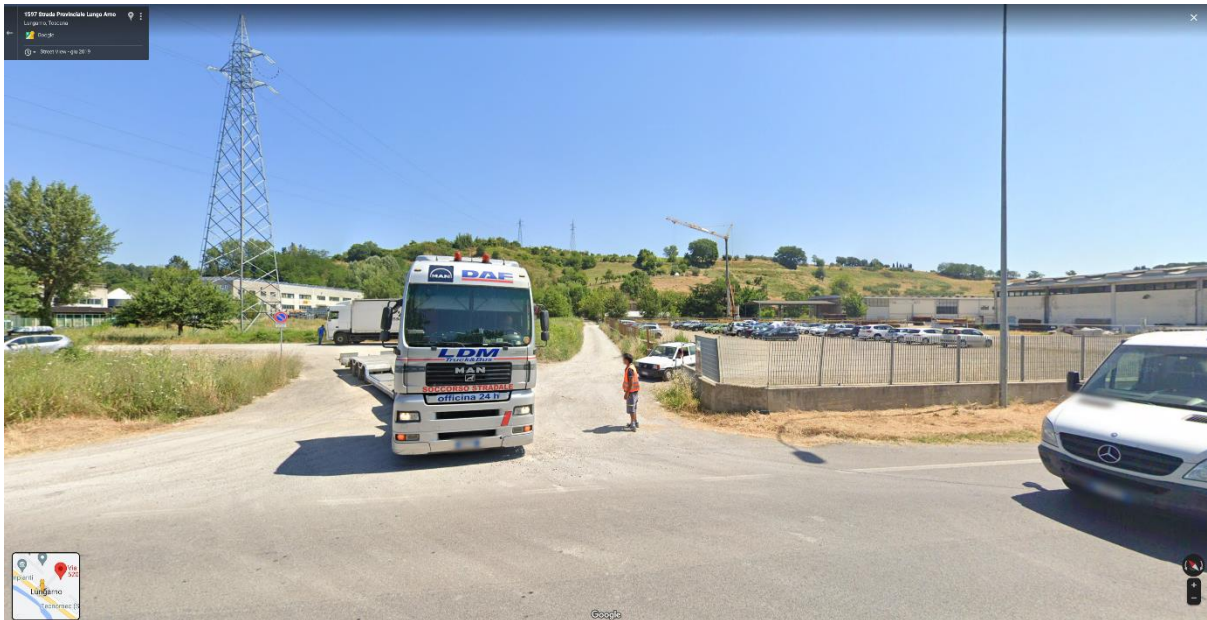
Foto 2 - Immagine all'intersezione con la provinciale.