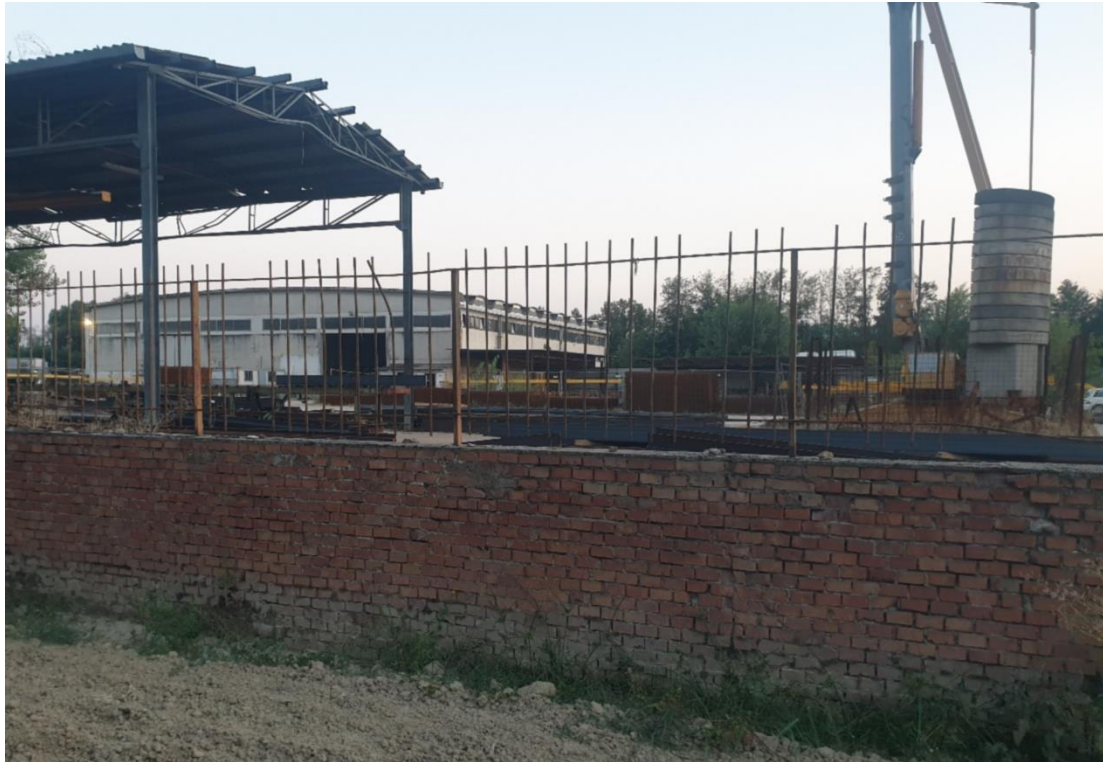
Foto 1 - Muro perimetrale