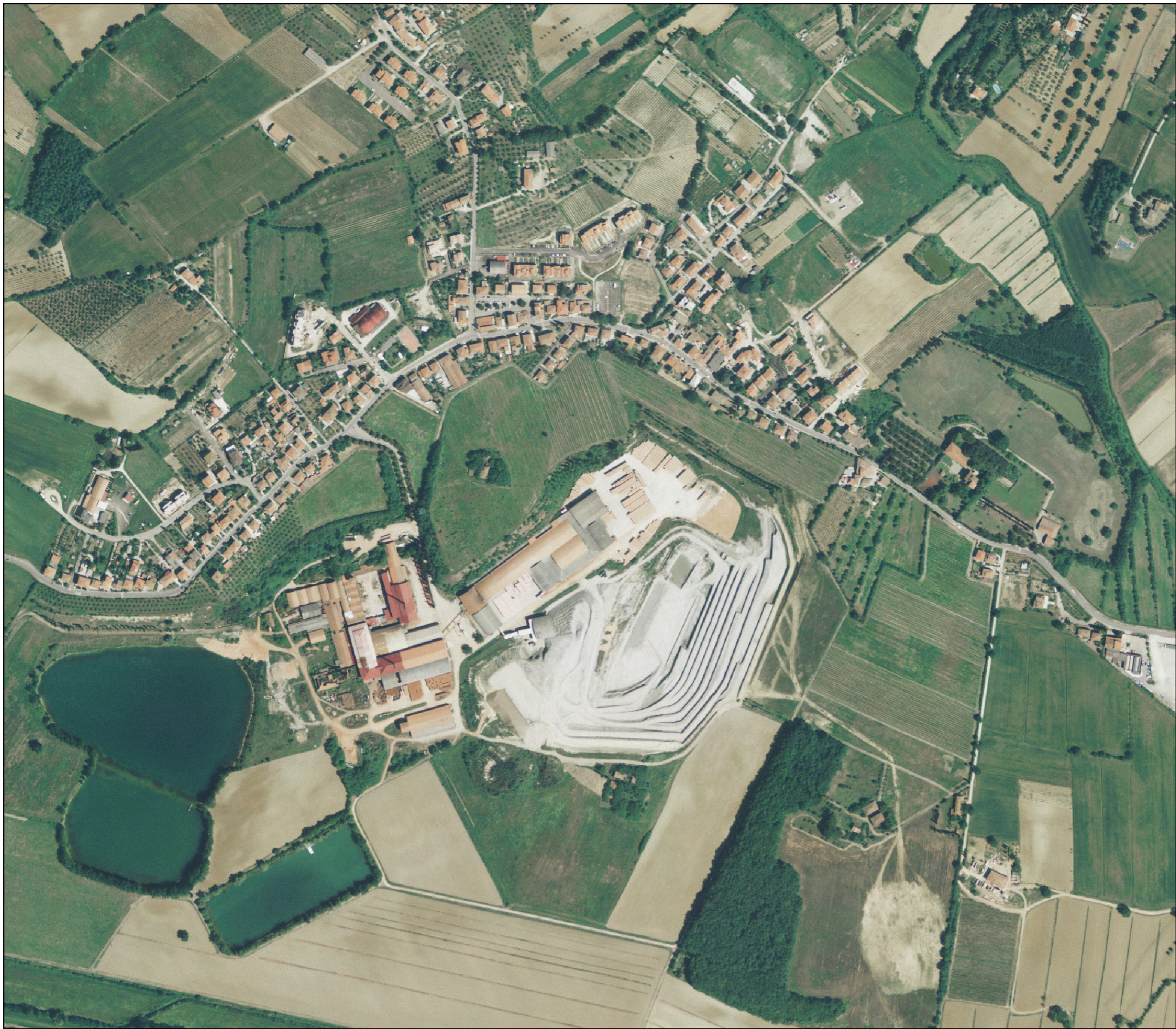
Ortofoto (2007) Guazzino