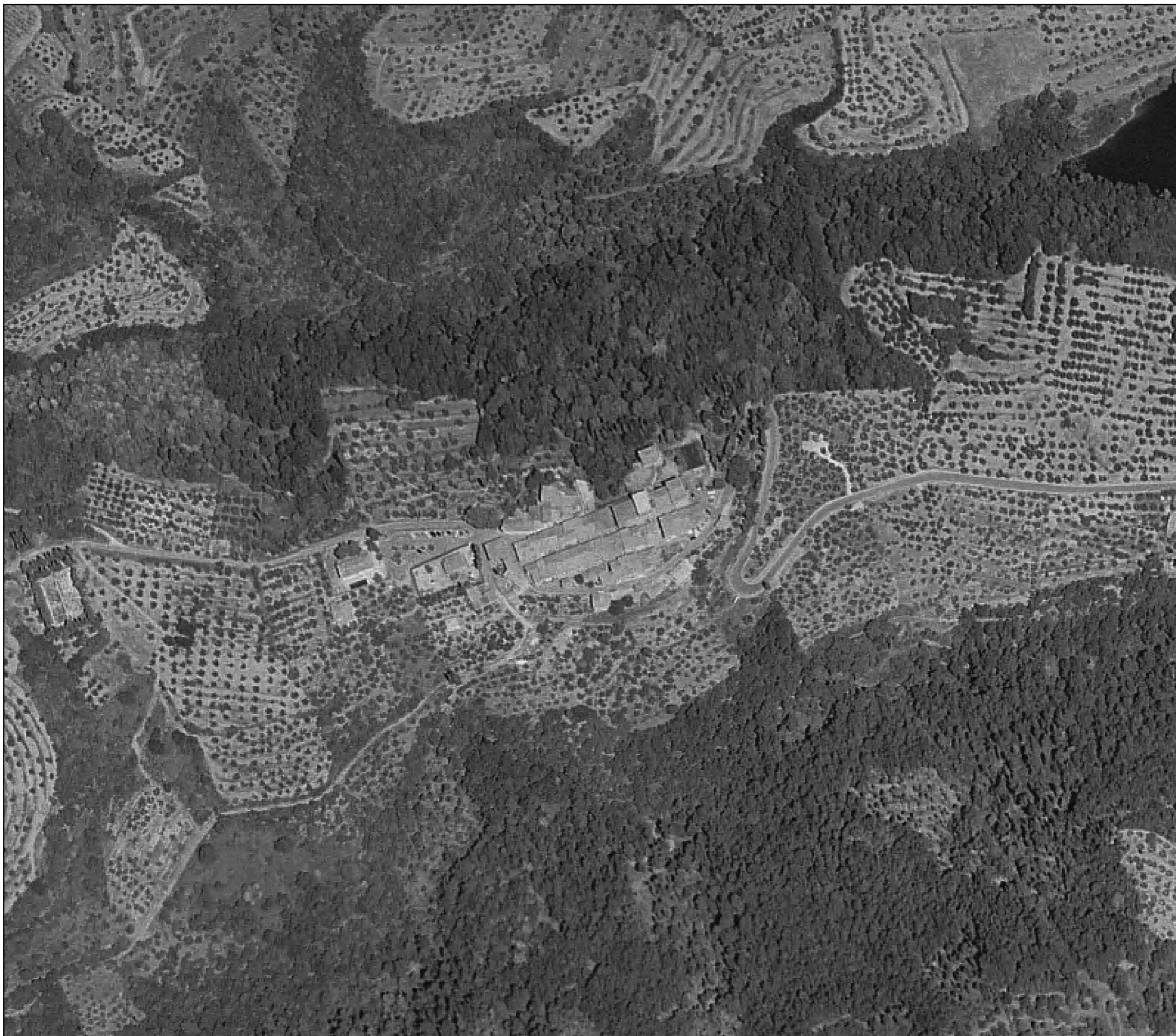
Ortofoto (2005) Farnetella