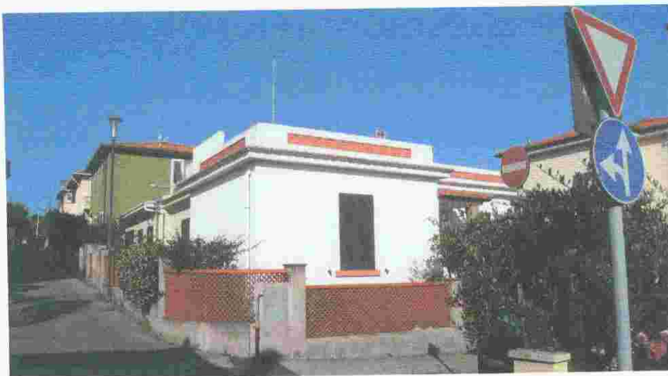
via ponchielli foto 5