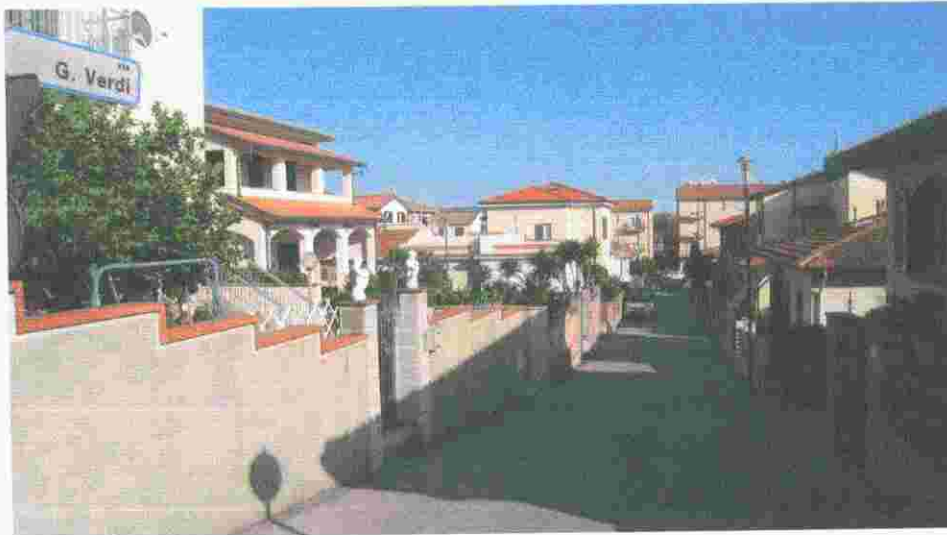
via ponchielli foto 4