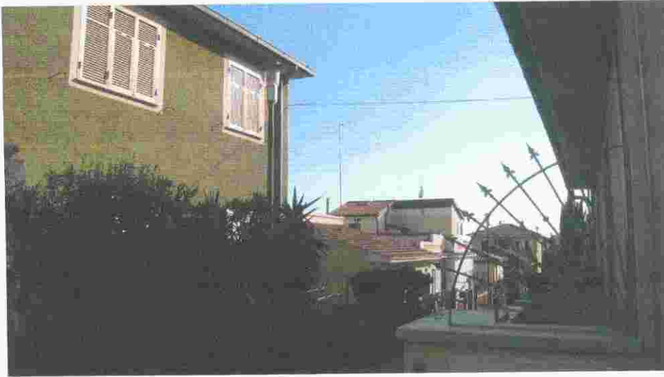
via Ponchielli foto 3