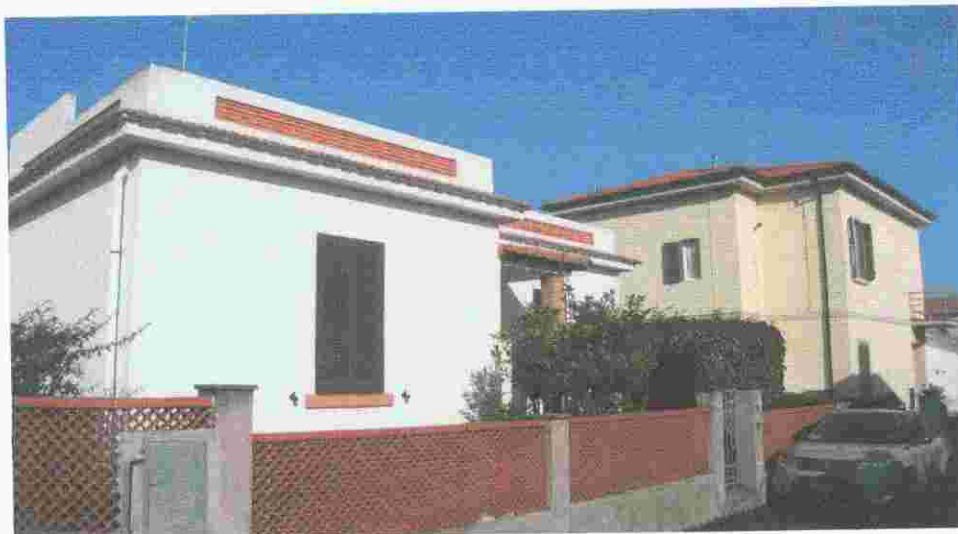
via Ponchielli Foto 2