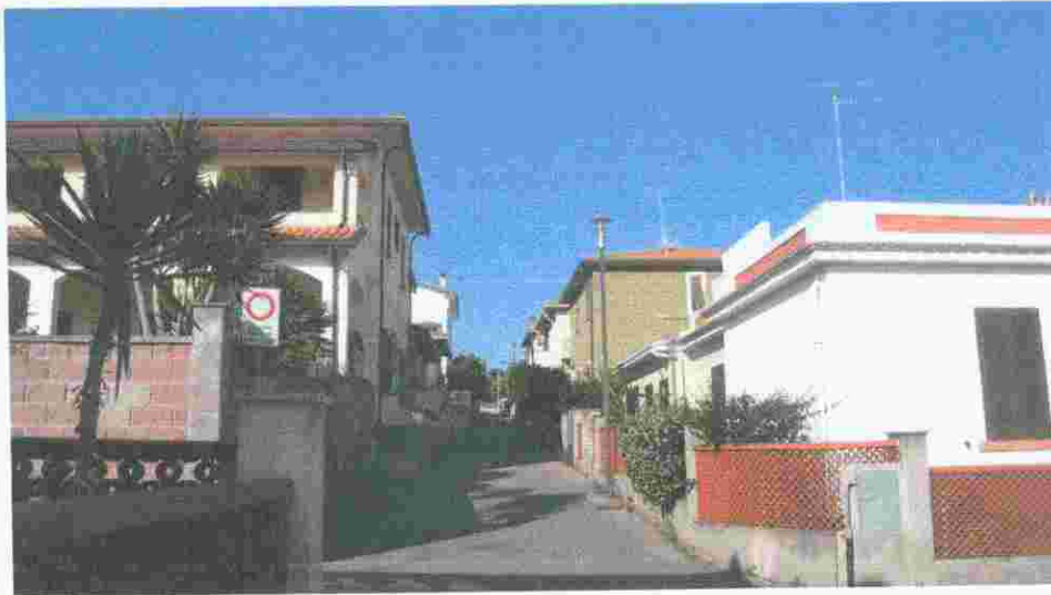
via Ponchielli Foto 1

In particolare si evidenziano edifici a due piani fuori terra realizzati con sopraelevazione di edifici semplici originali.