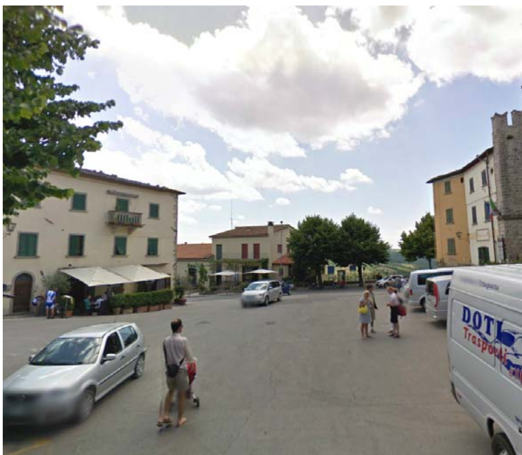
Fotografia 14 - La piazza si trova su un unico livello e la pavimentazione è ad asfalto, pertanto risulta omogenea. Se infatti da un lato la piazza rappresenta l'ingresso pedonale al centro storico, dall'altro è utilizzata come area di parcheggio o di manovra.