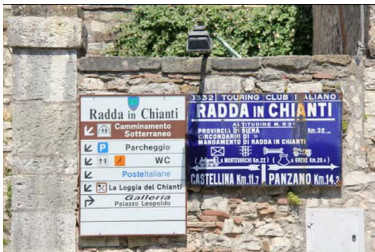
Fotografia 8 - Dall'attraversamento di cui sopra si ha inoltre accesso al parcheggio sotto stante attraverso due rampe di scale dotate di servoscala, come indicato anche nella segnaletica stradale di riferimento