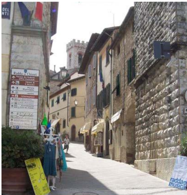
Fotografia 21 - Non viene considerato accessibile il superamento di un dislivello ottenuto esclusivamente mediante viabilità con pendenza continua e in assenza di piani di raccordo.

Via Roma è ad uso esclusivamente pedonale e non presenta marciapiedi, il tracciato risulta pertanto omogeneo anche se il selciato è in parte sconnesso. La viabilità presenta inoltre una pendenza abbastanza accentuata e non si rilevano aree di sosta in piano.