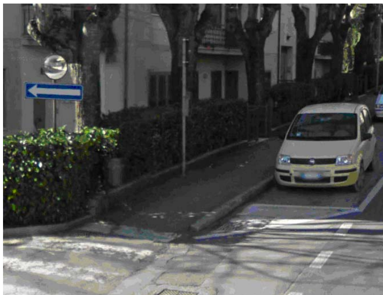
Fotografia 1 - In presenza dell'incrocio pedonale è assente una differenziazione tattile delle pavimentazioni ed una guida tattile indicante la mezzera dell'attraversamento pedonale ad uso delle persone cieche.

Il marciapiede, presente solo da un lato della carreggiata, si presenta di modesta larghezza anche dove la carreggiata presenta dimensioni più rilevanti e con caratteristiche tali, pendenza trasversale, eterogeneità della pavimentazione, presenza pali della pubblica illuminazione od altri manufatti in elevazione, da lasciare presagire una importanza marginale loro attribuita in confronto altre opere di urbanizzazione. A tali considerazioni si aggiunge anche la mancata continuità del percorso pedonale dovuta a vincoli altimetrici, al fatto che sovente non risultano tra loro collegati, o alle interruzioni in corrispondenza di accessi privati. Ne consegue una ben modesta usufruibilità da parte di tutti i pedoni, ma ovviamente una situazione ancor più problematica da parte di coloro che hanno problemi di deambulazione.