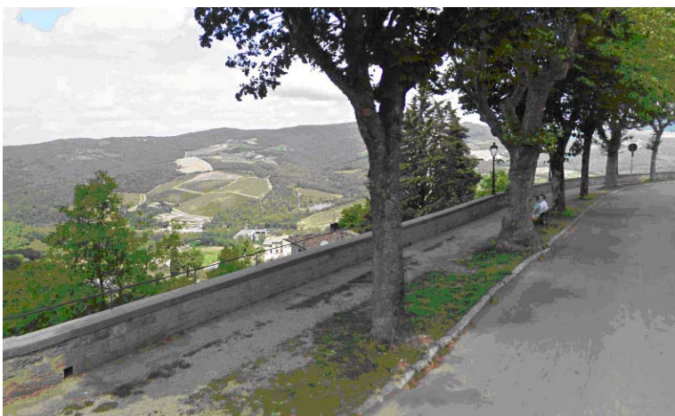
Fotografie 18 e 19 - La pavimentazione risulta parzialmente sconnessa lungo tutto il marciapiede a causa della presenza delle radici degli alberi leggermente affioranti e della vegetazione cresciuta nelle parti sconnesse del selciato.