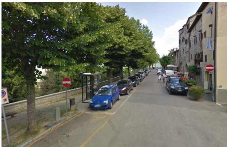
Fotografia 17 - Lungo viale Matteotti sono presenti anche posti auto e un posto riservato a portatori di handicap. L'accesso al marciapiede però è particolarmente difficoltoso per le persone disabili – specie se su sedia a rotelle – a causa dei numerosi intralci quali pali per la segnaletica, cabine contenenti impianti di vario genere, cestini porta rifiuti, cabina telefonica. Inoltre la pavimentazione del marciapiede risulta impervia, con risalti e sconnessioni.