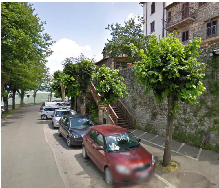
Fotografia 20 - Dal lato della carreggiata opposto a quello col marciapiede si trovano posti auto lungo strada e una scalinata a due rampe che conduce alla parte alta del centro storico, priva di servo scala e quindi non accessibile ai portatori di handicap su carrozzina.