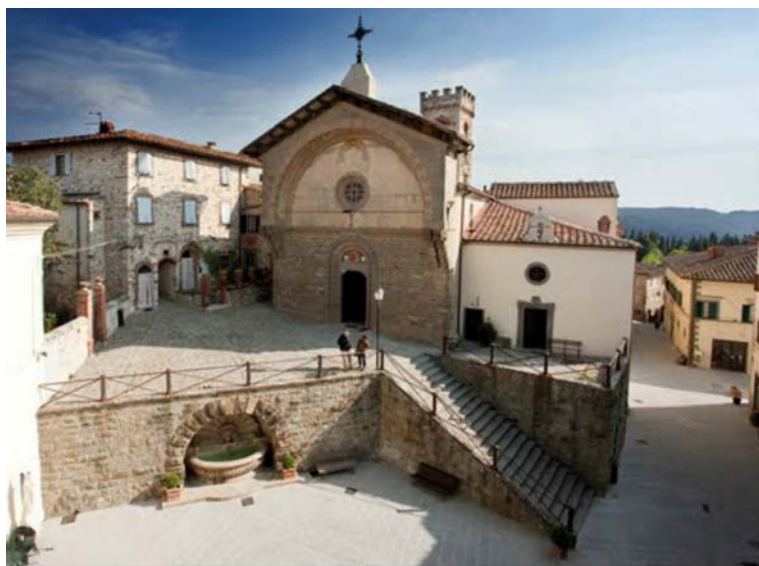
Fotografia 24 - L'accesso alla chiesa di San Niccolò, antistante il Palazzo comunale, è caratterizzato da un dislivello risolto con una rampa di scale ed è assente il servoscala.

Si segnala pertanto che per i luoghi aperti al pubblico lungo strada o marciapiede deve essere garantita la visitabilità, ovvero, per quanto riguarda il solo spazio esterno, deve esservi un percorso continuo che conduca fino all'ingresso a raso. (vedi D.P.R. 236/89 artt. 3, 5.2, 5.5, 5.6 e 5.7; D.P.R. 503/96 art. 13).