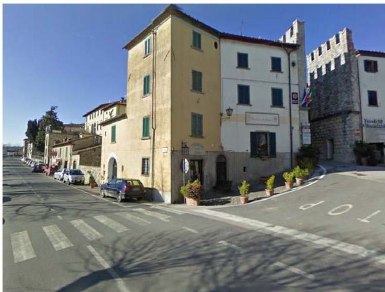
Fotografia 13 - Analoga considerazione può essere fatta per quanto riguarda l'accesso da via XX Settembre, dove l'attraversamento è ulteriormente intralciato dalla presenza della fioriere. Anche in questo caso l'attraversamento risulta inoltre in lieve pendenza e pertanto può risultare inaccessibile per una persona su carrozzina.