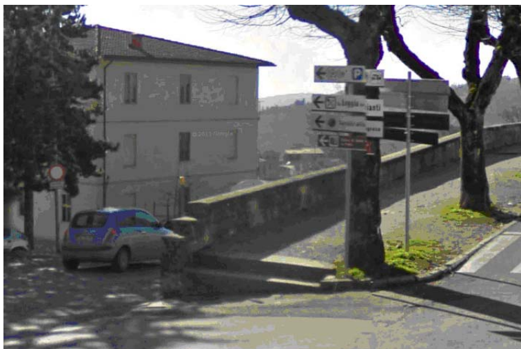
Fotografia 6 - In corrispondenza del doppio attraversamento pedonale si riscontra da una parte la presenza di due scalini che rendono inaccessibile l'ingresso alle carrozzine e dall'altro, sebbene sia presente solo un piccolo scalino, è comunque assente una differenziazione tattile delle pavimentazioni ed una guida tattile indicante la mezzeria dell'attraversamento pedonale ad uso delle persone cieche

Da via XX Settembre si ha l'accesso ad un parcheggio pubblico che si trova ad un livello inferiore raggiungibile attraverso due rampe di scale dotate di servoscala.