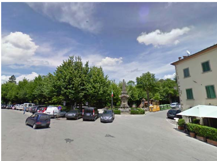
Fotografia 15 - Sono assenti marciapiedi su tutti i lati della piazza e l'accesso al piccolo giardino pubblico è comunque caratterizzato dalla presenza di uno scalino lungo tutto il suo perimetro.