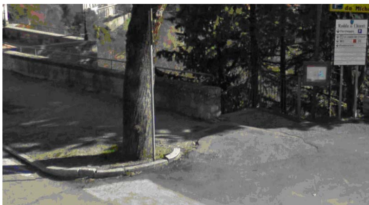
Fotografia 7 - In corrispondenza del secondo attraversamento pedonale si riscontra da una parte un piccolo scalino e dall'altra invece si ha una soluzione di continuità del piano di calpestio. La pavimentazione risulta comunque parzialmente sconnessa lungo tutto il marciapiede a causa della presenza delle radici degli alberi leggermente affioranti. Sono comunque assenti le differenziazioni tattili delle pavimentazioni all'attraversamento pedonale ad uso delle persone cieche.