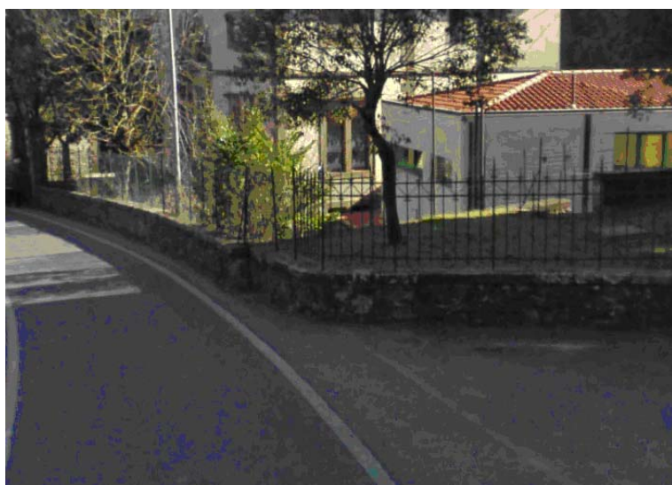
Fotografia 2 - In alcuni tratti il marciapiede risulta assente da entrambe le parti della carreggiata.