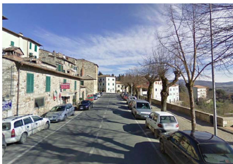
Fotografie 9 e 10 - Una visione d'insieme di via XX Settembre mostra chiaramente come il marciapiede si trovi esclusivamente dalla parte di carreggiata precedentemente analizzata.

Si segnala pertanto che per i luoghi aperti al pubblico lungo strada o marciapiede: deve essere garantita la visitabilità di tali unità immobiliari, ovvero, per quanto riguarda il solo spazio esterno, deve esservi un percorso continuo che conduca fino all'ingresso a raso. (vedi D.P.R. 236/89 artt. 3, 5.5, 5.6 e 5.7; D.P.R. 503/96 art. 13).