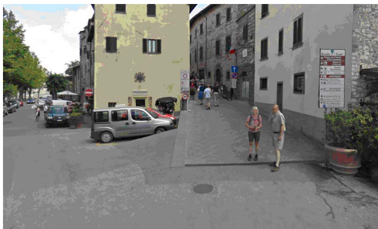
Fotografia 16 - L'accesso all'area pedonale è caratterizzato dal cambio di pavimentazione e dalla presenza di un piccolo scalino che introduce al camminamento pedonale con una lieve pendenza ma privo di aree piane di raccordo.

Piazza Dante presenta le stesse problematiche riscontrate per Piazza IV novembre, sia per tipologia di utilizzo della piazza stessa sia per il piano di calpestio non regolare. Inoltre anche l'accesso al centro storico è caratterizzato da un piccolo dislivello altimetrico privo di apposita segnalazione.