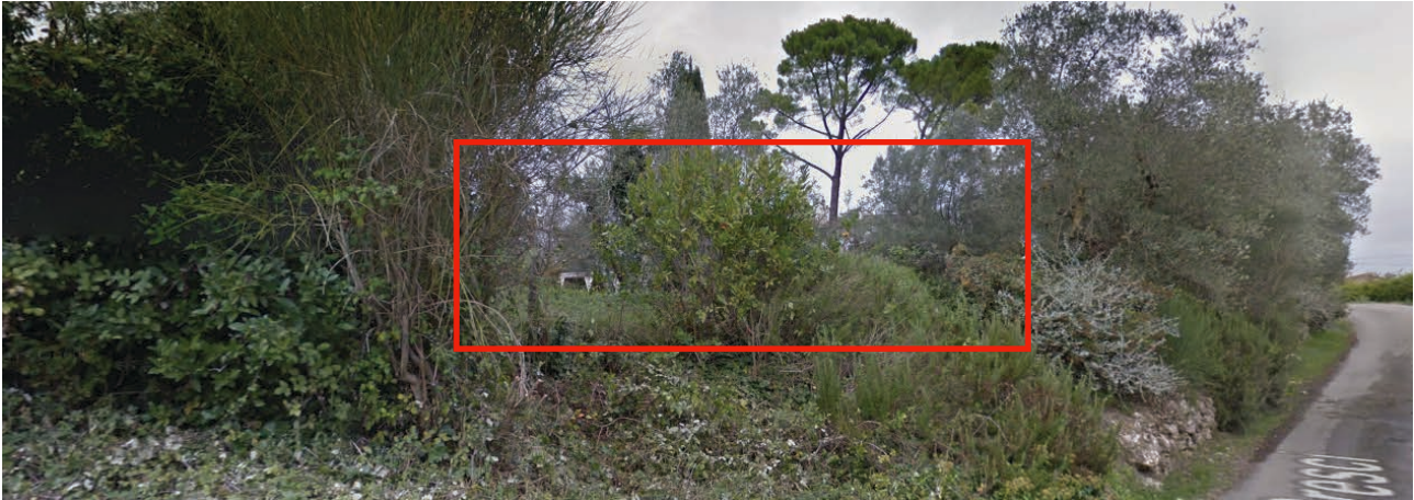
IC1.2. veduta dell'area di intervento contigua al muro del giardino della villa

L'intervento comprende la sistemazione di via San Cresci.