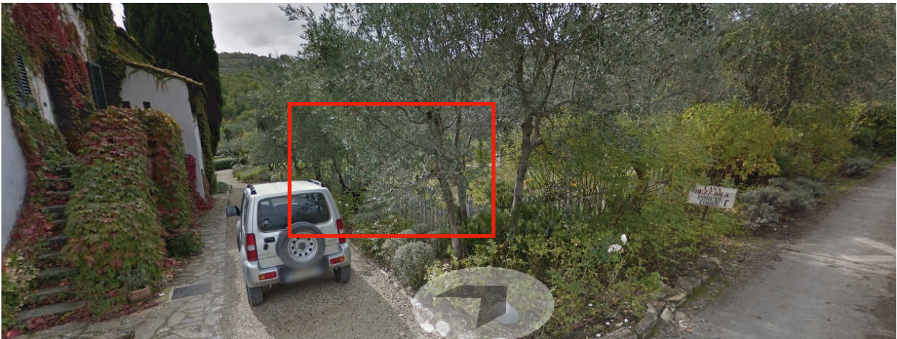
IC1.2. veduta dell'area di intervento lungo la strada sul retro e l'oliveto a nord della villa