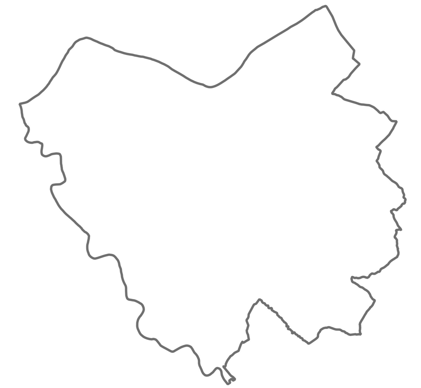
TAVOLA 1.52 quater SCALA 1:10.000