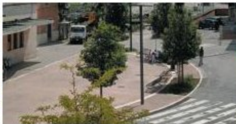
Lavori importanti. Nativi di riavvio con la riqualificazione dell'area ex Scalo Mercè a Poggibonsi

«Sono partiti i lavori per sistemare e riqualificare l'area ex scalo merci di Poggibonsi, ovvero l'area compresa tra piazza della stazione e l'area Sordelli. Da oggi sarà chiuso il parcheggio e non sarà consentita la sosta con l'aiuto all'interno e nelle zone limitrofe ad esso interne ai lavori. Il progetto si collega alla serie di interventi pubblici che muovono dai finanziamenti ricevuti quest'anno attraverso il Prr, finanziamento nel caso di specie di 770mila euro e che ha come oggetto di fatto l'intervento di rigenerazione urbana di questa zona. I lavori comprendono proprio l'area ex scalo merci stessa, ossia tutto il perimetro che fino a prima era adibito a parcheggio gratuito e oggi per le esigenze delle ferrovie è l'area subito adiacente all'ingresso del parcheggio comunicante con la stazione. Per fare chiarezza, il comune ha acquistato circa due anni fa l'area interessata dalle ferrovie