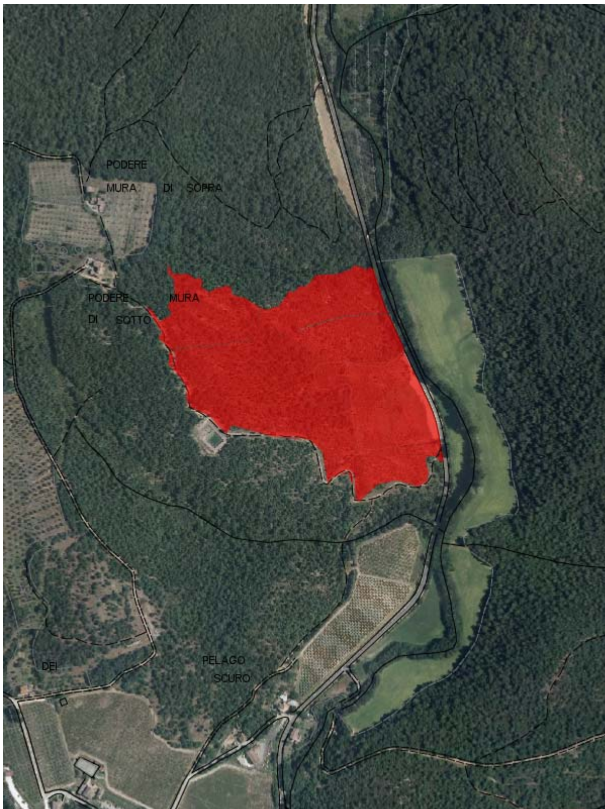
Fascicolo territoriale n. 4 - 2006 Inquadramento generale - Scala 1:10000