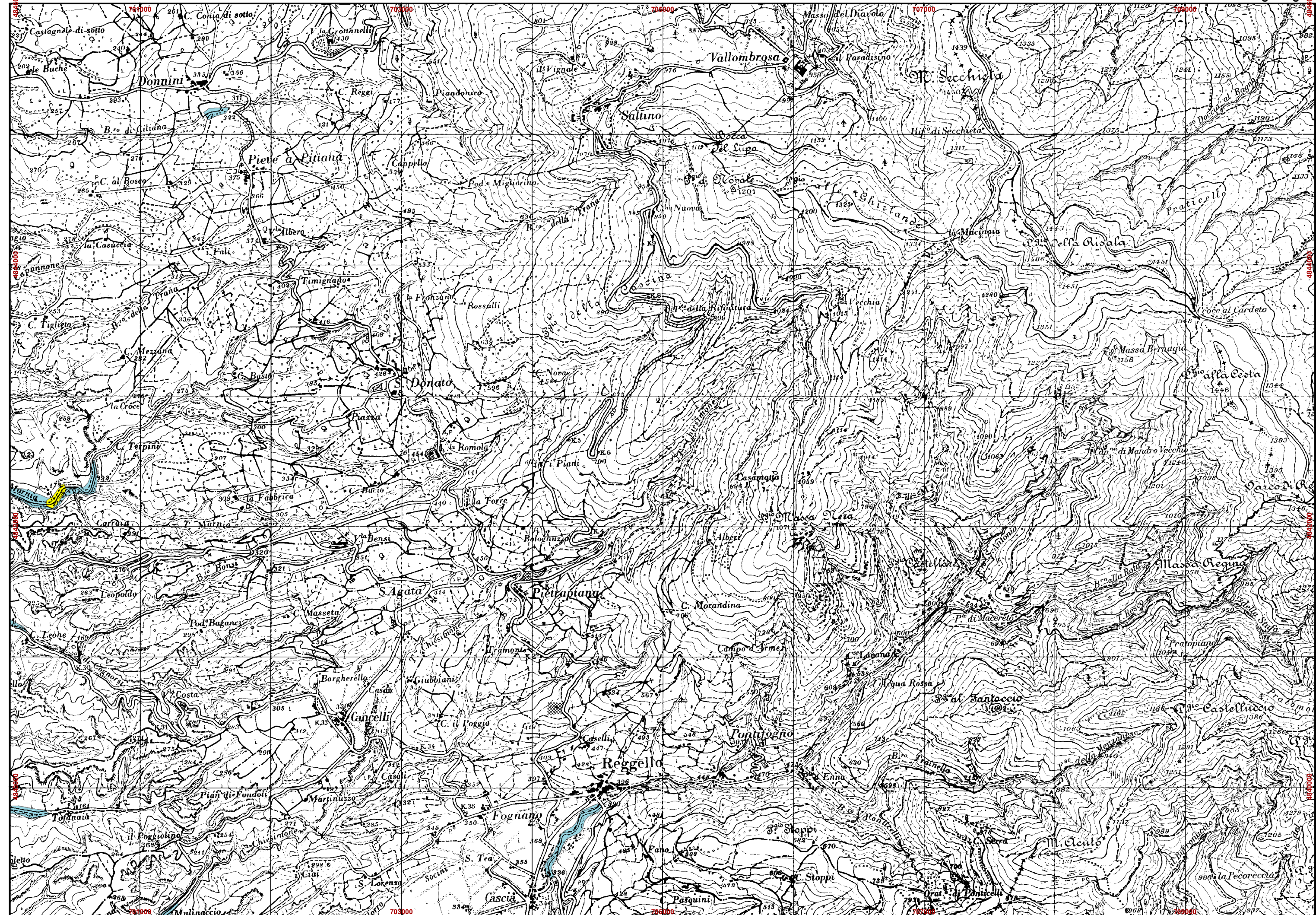
Perimetrazione delle aree con pericolosità idraulica - livello di sintesi

Piano di Bacino del fiume Arno - Piano Stralcio Assetto Idrogeologico