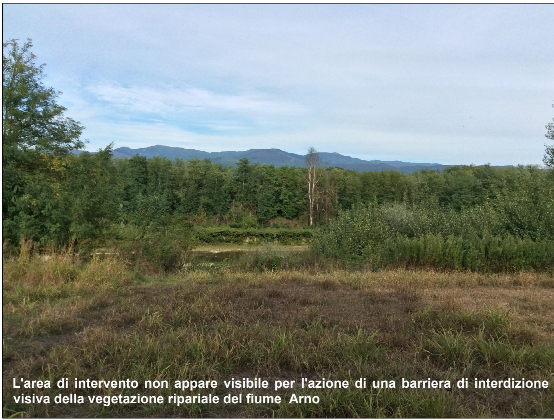
- Visuale verso l'area d'intervento dalla pista ciclabile di Figline Valdarno

L'area di intervento non appare visibile per l'azione di una barriera di interdizione visiva della vegetazione ripariale del fiume Arno